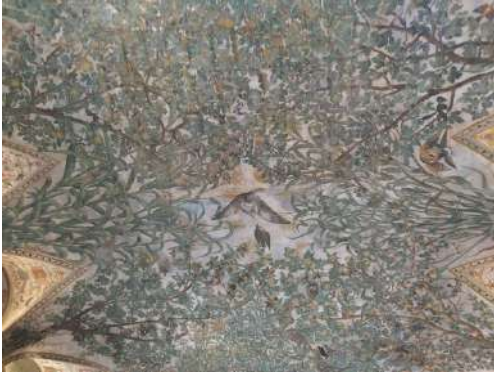
Palazzo Grimani sala del fogliame soffitto