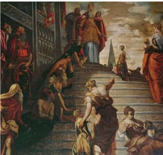
Tintoretto Presentazione della Vergine al tempio, Madonna dell'Orto

2 Tintoretto: visita alla chiesa di Madonna dell'Orto, dove si ammira ancor oggi uno dei cicli più famosi di Jacopo Tintoretto, che aveva la sua bottega nelle vicinanze e che fu sepolto all'interno della chiesa. Visita alla chiesa di San Felice dove si conserva una sua opera giovanile.