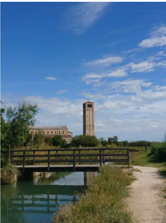
Isola di Torcello chiesa di Santa Maria Assunta esterno