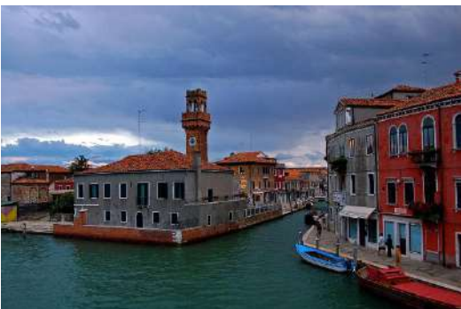
Isola di Murano canal grande