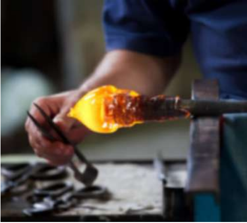
Lavorazione in fornace