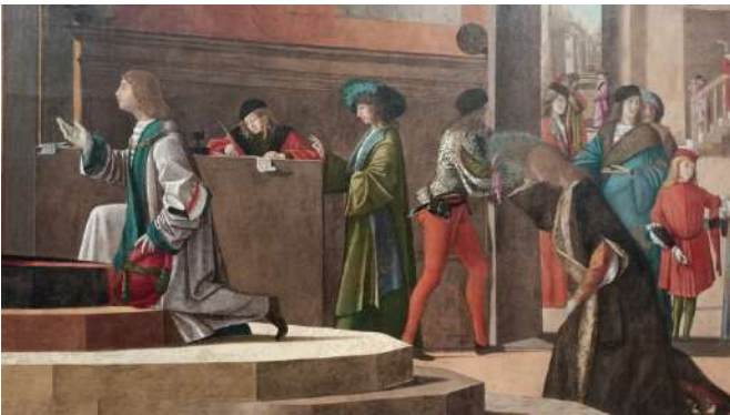
Carpaccio ciclo S.Orsola commiato degli ambasciatori

4 Carpaccio: visita delle Gallerie dell'Accademia dove si possono ammirare i teleri del ciclo di Sant'Orsola e dei Miracoli e della Scuola Dalmata di San Giorgio e Trifone con le opere dedicate ai santi patroni