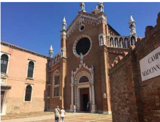
chiesa della Madonna dell'Orto facciata

La chiesa gotica conserva ancor oggi pregevoli opere di Jacopo Robusti, detto il Tintoretto che qui vi è sepolto. Accanto alla chiesa si trova l'antica scuola dei mercanti.