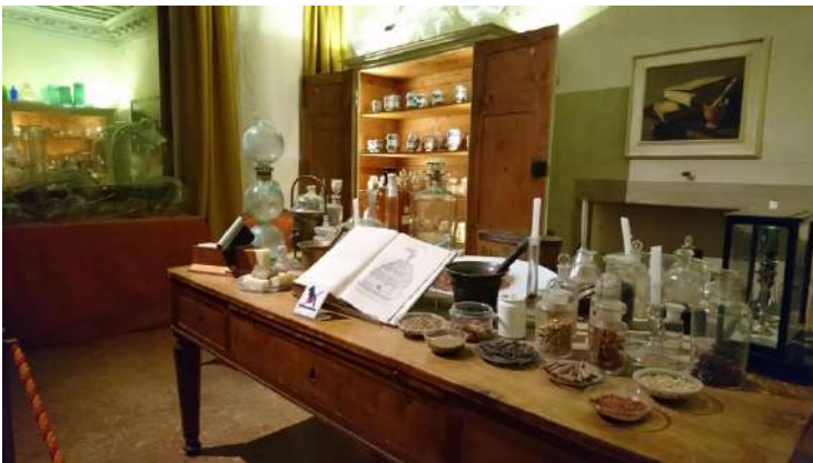
Palazzo Mocenigo tavolo con spezie e aromi

Dimora gentilizia a Venezia, oggi Centro Studi di Storia del Tessuto, del Costume e del Profumo, dove si può seguire il percorso sensoriale del profumo e delle spezie.