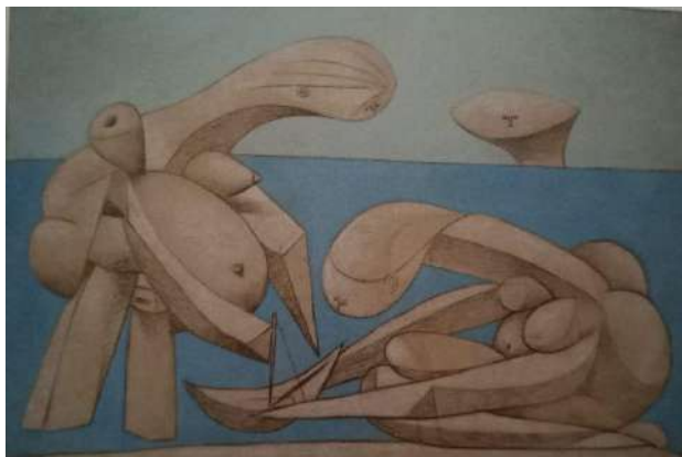
Picasso Le bagnanti

Nobiltà e ricchezza della Venezia aristocratica