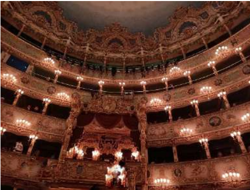
Teatro La Fenice palco d'onore

Principale teatro lirico di Venezia, nonché uno dei più prestigiosi al mondo. Il teatro è stato ricostruito dopo l'incendio del 1996.