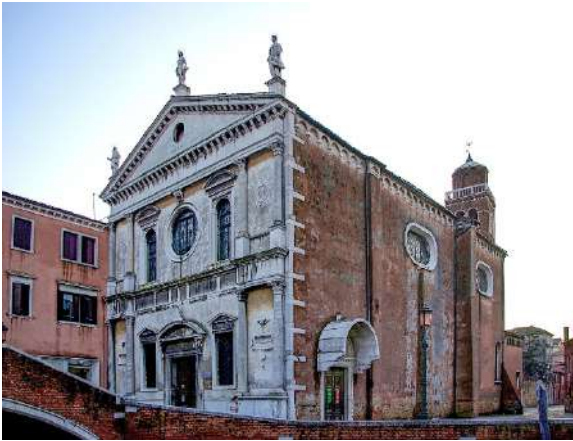
Chiesa di San Sebastiano esterni

La chiesa si trova nel sestiere di Dorsoduro. Nel XVI secolo vi lavorò per un lungo periodo il famoso pittore Paolo Caliari, detto il Veronese, di cui si conserva un notevole ciclo pittorico dedicato a San Sebastiano.