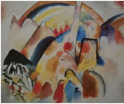
Kandinskij paesaggio con macchie rosse n 2