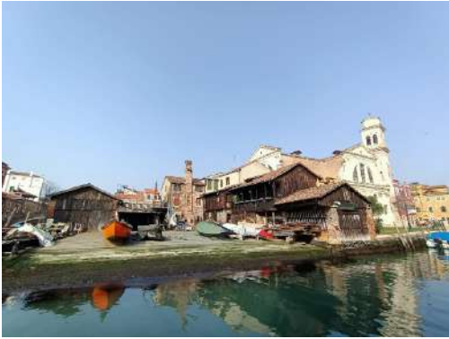
San Trovaso squero delle gondole