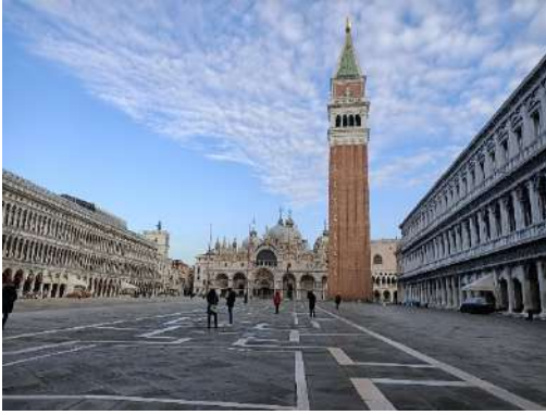
Piazza San Marco

Venezia insolita: alla ricerca della venezianità nei sestieri della città (visite esterne)