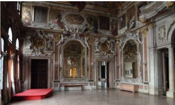
Ca' Zenobio salone degli stucchi

Palazzo del periodo barocco con un importante salone da ballo decorato da stucchi dorati. D'interesse è anche il giardino, uno dei pochi rimasti a Venezia. Dall'Ottocento divenne sede del collegio mechtarista armeno.