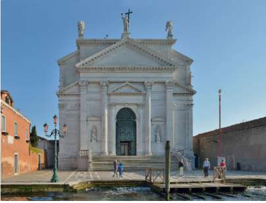
Chiesa del Redentore facciata isola della Giudecca