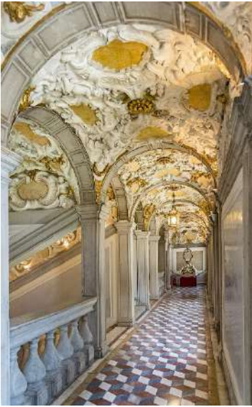
Scuola Grande dei Carmini . scalone e corridoio

quali tele del Tiepolo e del Padovanino e una pregevole decorazione a stucco.