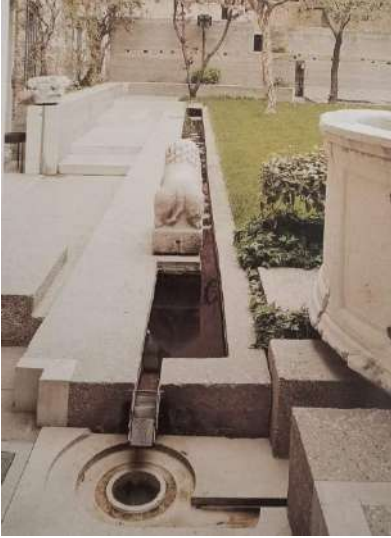
Palazzo Querini Stampalia giardino di Carlo Scarpa