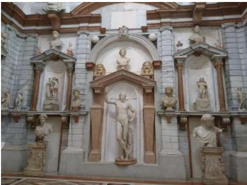
Palazzo Grimani statue della tribuna

Il palazzo è, per la storia dell'arte e dell'architettura un elemento unico e prezioso. Importante la sua architettura all'antica e le decorazioni ricche di enigmi e di simboli.