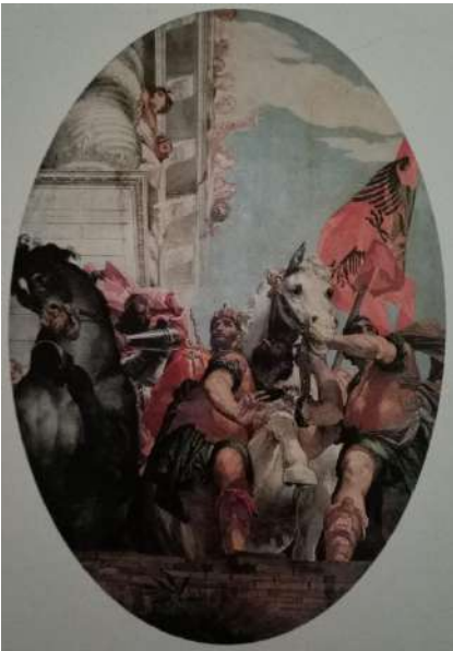
Veronese trionfo di Mordechai chiesa di san Sebastiano

3 Veronese: visita alla chiesa di San Sebastiano. Qui si conserva uno dei cicli pittorici più importanti del pieno Rinascimento, dipinto da Paolo Veronese.