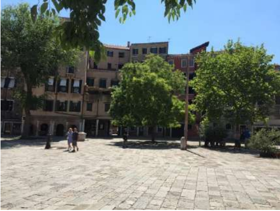
Campo del Ghetto nuovo