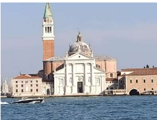
Chiesa di San Giorgio Maggiore facciata vista dall'acqua

La chiesa del Redentore e di San Giorgio Maggiore, costruite rispettivamente dall'architetto Palladio per i padri cappuccini e per i monaci benedettini. Le chiese riassumono in maniera esaustiva l'opera di Palladio a Venezia.