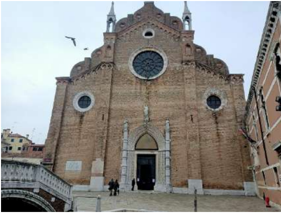
Basilica Santa Maria Gloriosa dei Frari facciata

Complesso gotico costruito dai padri francescani, la chiesa ospita opere a partire dal XIV al XIX secolo, tra le quali la pala d'altare dell'Assunta di Tiziano, suo capolavoro giovanile. Qui venne sepolto lo scultore neoclassico Antonio Canova.