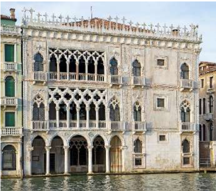
Ca' d' Oro facciata

Palazzo gotico nel sestiere di Cannaregio, offre una variegata raccolta di oggetti tra i quali dipinti, sculture, arazzi, mobili, medaglie e terracotte, che sono conservati nei due piani dell'edificio.