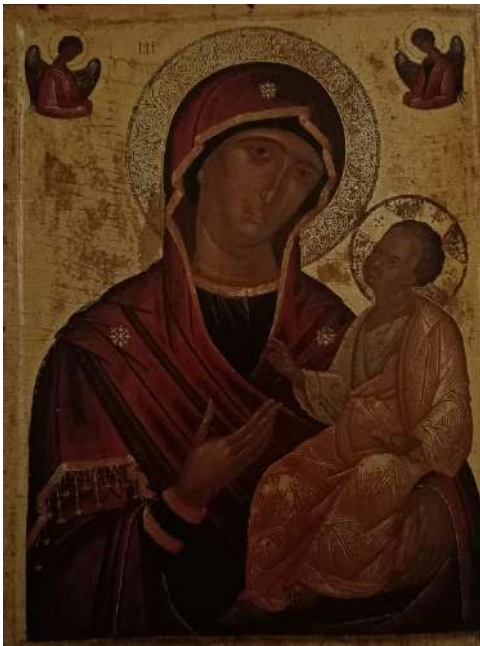
Icona cretese Madonna della Passione

Unico nel suo genere, il museo conserva una collezione di icone portate a Venezia; numerose di esse furono dipinte da artisti cretesi.