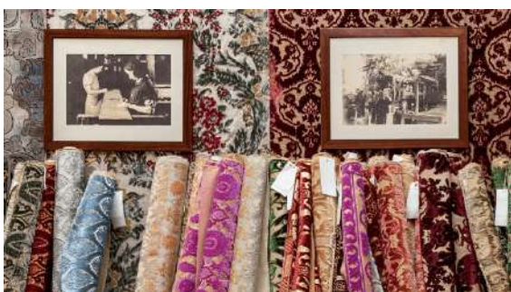
Tessuti Bevilacqua velluti soprarizzo

Visita a due atelier di tessuti. Avrete modo di conoscere quali tessuti i veneziani portavano a Venezia dall'Oriente e di come si lavoravano.