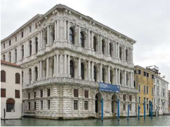
Ca' Pesaro facciata sul Canal Grande