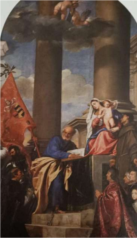
Tiziano Pala Pesaro chiesa dei Frari

2 Tintoretto: visita alla chiesa di Madonna dell'Orto, dove si ammira ancor oggi uno dei cicli più famosi di Jacopo Tintoretto, che aveva la sua bottega nelle vicinanze e che fu sepolto all'interno della chiesa. Visita alla chiesa di San Felice dove si conserva una sua opera giovanile.