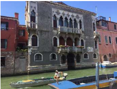
Cannaregio Palazzo Mastella

L'itinerario propone un percorso alternativo a quello della più nota Strada Nuova. I luoghi di interesse storico sono: i Gesuiti, i Crociferi, la Scuola Grande della Misericordia, la chiesa di Madonna dell'Orto ed il Ghetto.