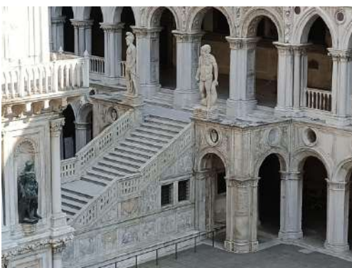
Palazzo ducale scala del gigante

Centro del potere politico del governo ducale che fu la sede del governo di Venezia nonché la residenza del doge. La Basilica fu la cappella ducale ed è rinomata per i suoi splendidi mosaici.