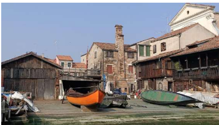
Squero di San Trovaso barche e gondola

Visita allo squero più antico di Venezia, dove ancor oggi vengono costruite e riparate le gondole, è possibile anche la visita ad un laboratorio di forcole e remi.