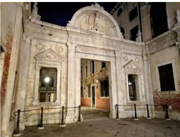
Scuola Grande di San Giovanni Evangelista septo marmoreo

La Scuola Grande di San Giovanni Evangelista è un complesso architettonico caratterizzato da un imponente portale rinascimentale. Si sviluppa su due piani e abbraccia diversi stili architettonici, dal Gotico e Rinascimento al Barocco. All'interno ospitava il ciclo del Miracolo della Croce di Gentile Bellini.