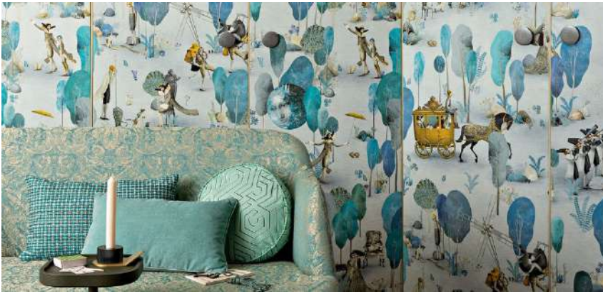
Rubelli rivestimenti murali