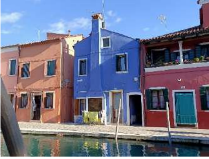
Burano case colorate